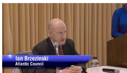
Ian Brzezinski Atlantic Council

Panel discussion about Florida, Poland and the 3 Seas Polish Floridian Business Group